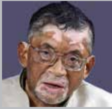
Shri. Santosh Gangwar Minister of State for Finance

“ At the very outset please accept my heartiest congratulations for your contribution, hard work and dedication for the wonderful work being undertaking in the field of multifarious activities for the betterment and upliftment of the weaker section of the society. Your efforts deserves commendations and needs whole hearted support to you. ”