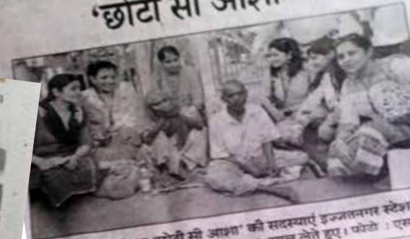
सामाजिक संस्था 'छोटी सी आशा' की सदस्यता इज्जतनगर स्टेशन पर बेसहारा दम्पति का हाल - चाल लेते हुए। छोटी सी आशा ने